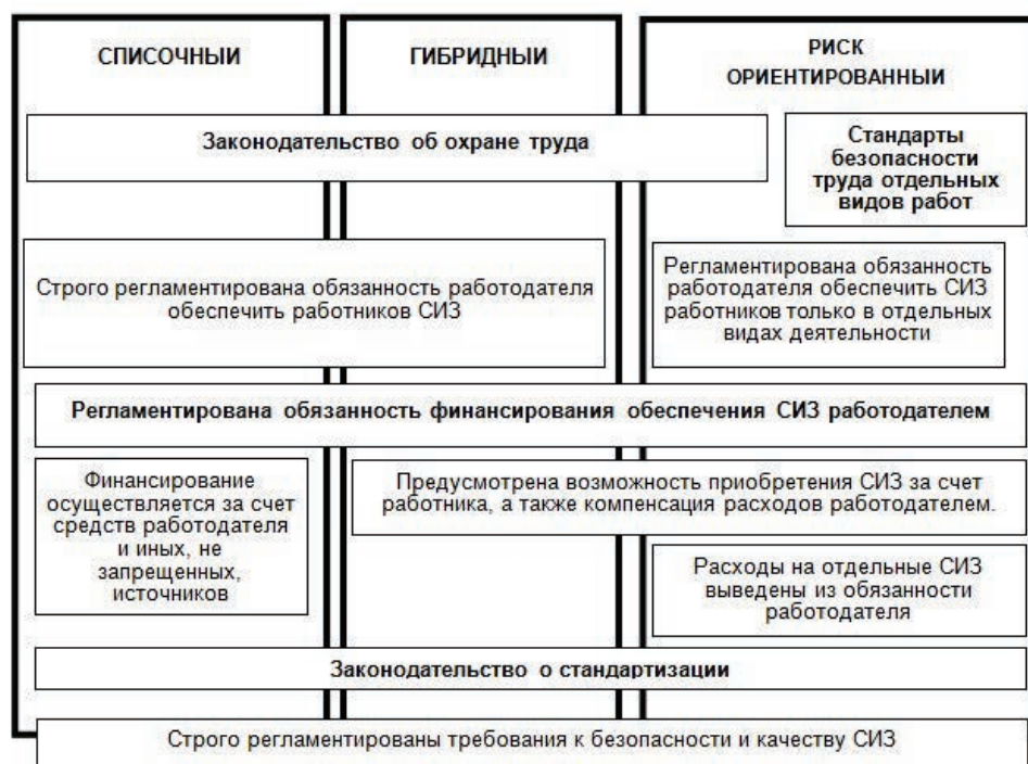
Рис. 1. Правовая основа подходов и регламентирующих норм в обеспечении СИЗ

регламентированная обязанность работодателя обеспечивать работников СИЗ. Для риск-ориентированного подхода характерно регламентирование обязанности работодателя обеспечивать СИЗ работников только в отдельных видах деятельности (строительство, погрузочно-разгрузочные работы). При списочном подходе финансирование осуществляется за счет средств работодателя и иных, не запрещенных источников, гибридного и риск-ориентированному подходам характерна возможность приобретения СИЗ за счет работника, а также компенсация расходов работодателем (рис. 1).