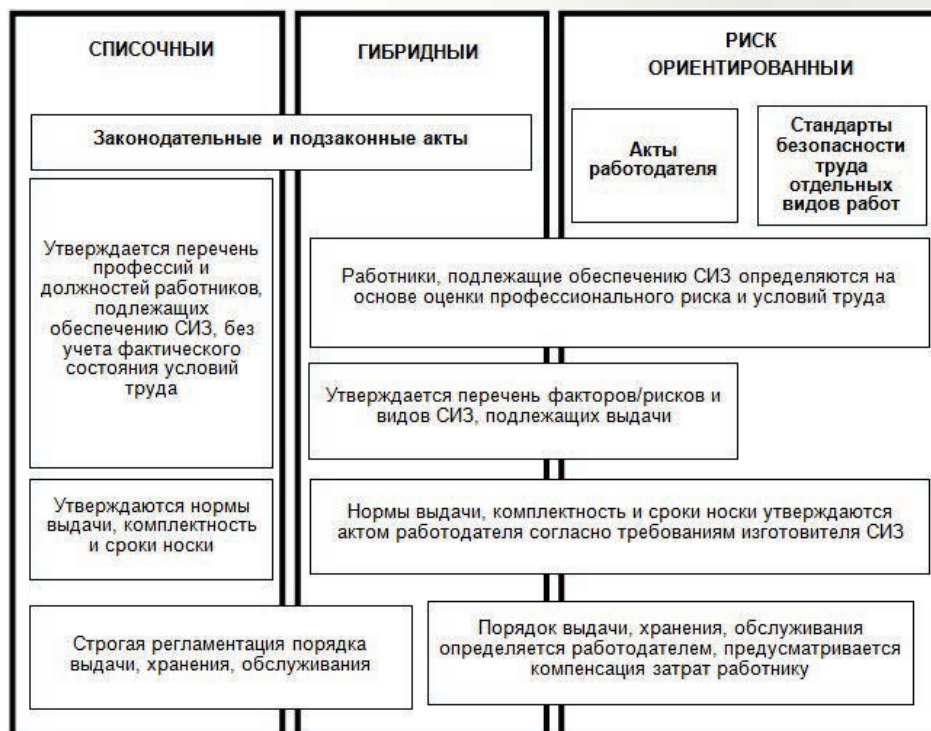
Рис. 2. Механизм обеспечения СИЗ